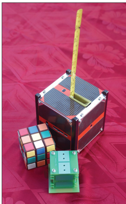
Kockák, magyar módra: Masat-1, Rubik és BME-1

Az Oscar-40-nel eljutottunk a csúcsra. Több mint fél tonna(!) súly, 600 W teljesítményű nap-elemek és saját pályakorrekciós hajtóművek. Az Ariane 5 rakéta startköltsége 4,5 millió USD volt. Start 2000-ben. A végeredmény: